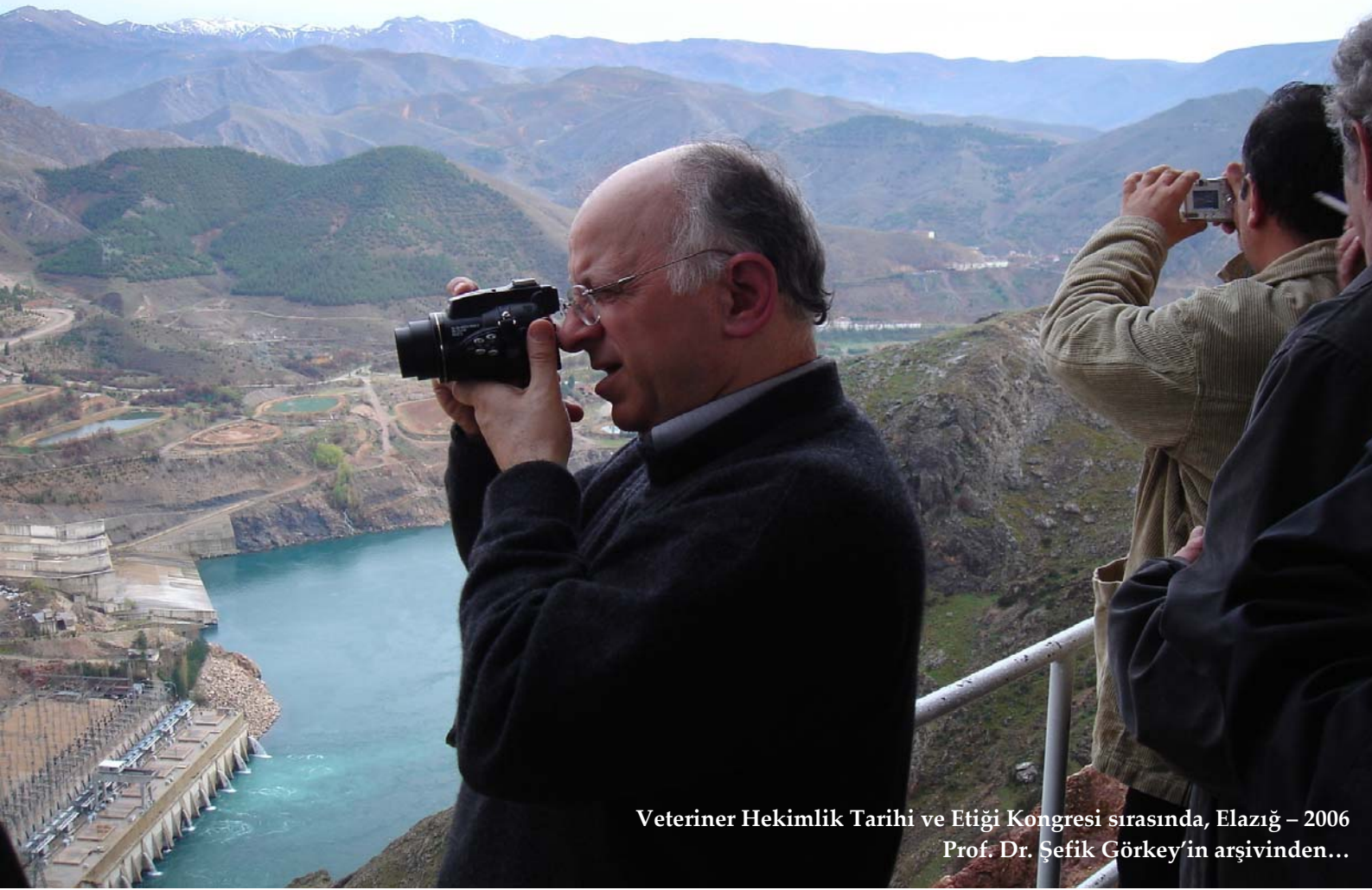
Veteriner Hekimlik Tarihi ve Etiği Kongresi sırasında, Elazığ – 2006